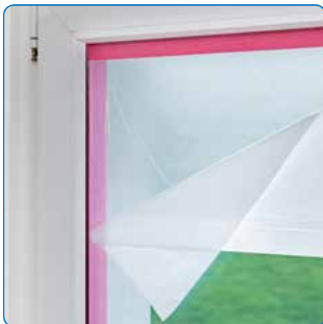
UV-bestendige lijm voor directe zonstraling