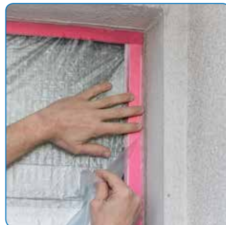
Snel en exact fixeren van CQ en folie