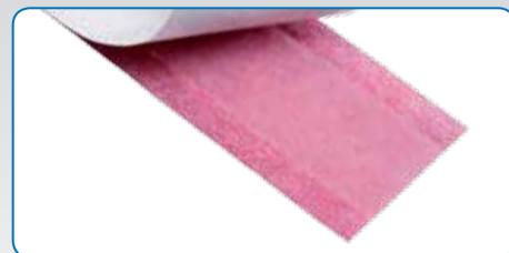
Randstroken aan beide kanten lijm-vrij

Exclusief bij STORCH - patent aangevraagd