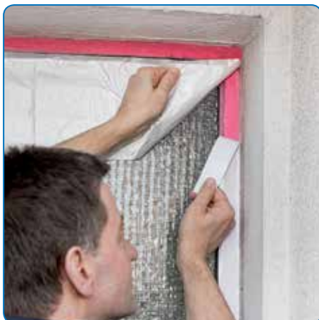
Probleemloos gebruik op ondergronden die gevoelig zijn voor weekmakers