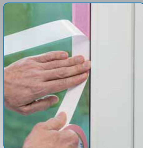
Probleemloos afplakken van ondergronden die gevoelig zijn voor weekmakers